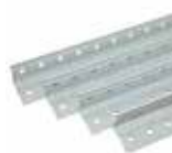
завальцованный край увеличивает жёсткость стойки