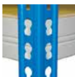
Замок с зацепами